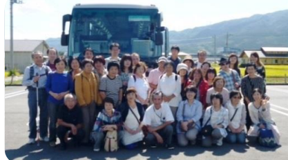
障害者支援の地域づくり事業 (障がい者・支援者交流バス旅行)