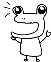
鶴ヶ島市社協マスコット メルメル・ゲーコ