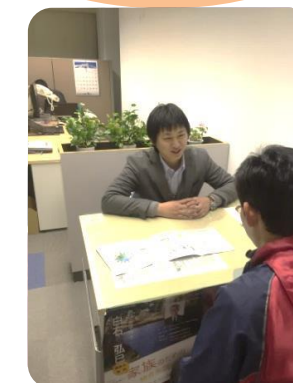
生活サポートセンター受付