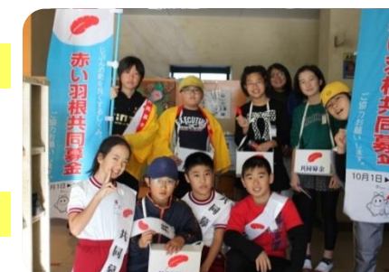
赤い羽根共同募金運動 (委員会活動で子どもたちが実施)