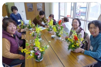
ふれあい・いきいきサロン (地域のサロンでフラワーアレンジメント)