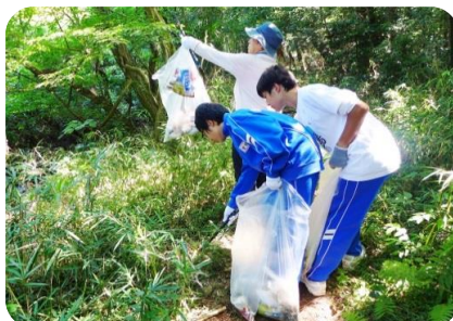
彩の国ボランティア体験プログラム (里山整備体験)