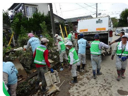
災害ボランティア・バス (茨城県常総市にて実施)